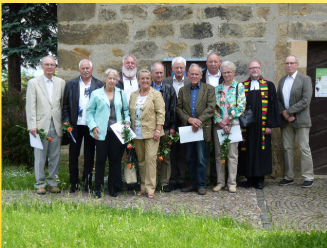
Diamantene Konfirmation in Cumbach - Gruppenfoto nach dem Gottesdienst vor der Kirche

Bei allen Helferinnen und Helfern möchten wir uns recht herzlich bedanken, die uns tatkräftig mit Kuchen und Ihrem Einsatz unterstützt haben. Mit ihrer Hilfe haben Sie für das gute Gelingen beigetragen. Einen besonderen Dank den fleißigen Bäckern für ihre wohlschmeckenden Kuchen! Unsere Tanzfestbesucher im Kirchenkaffee haben sie mit großem Lob und den schönsten Worten für den guten Geschmack und deren Vielfalt gelobt. Und diesen Dank möchten wir Ihnen auf diesem Weg weitersagen.